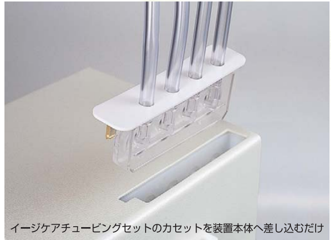
イージーケアチュービングセットのカセットを装置本体へ差し込むだけ